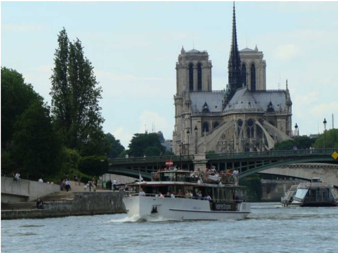
Visite de Paris sur la Seine.