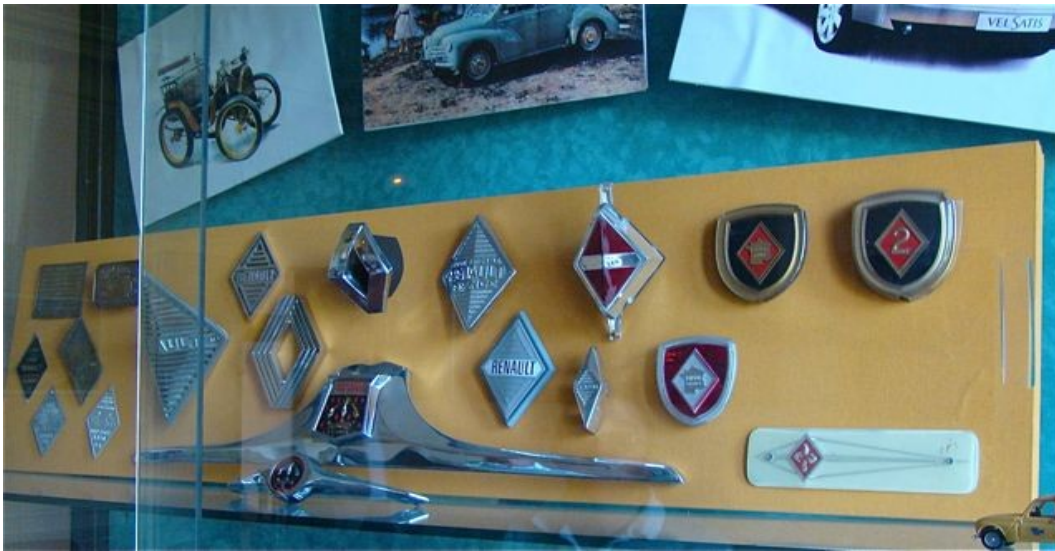
Prototypes d'écussons Renault.