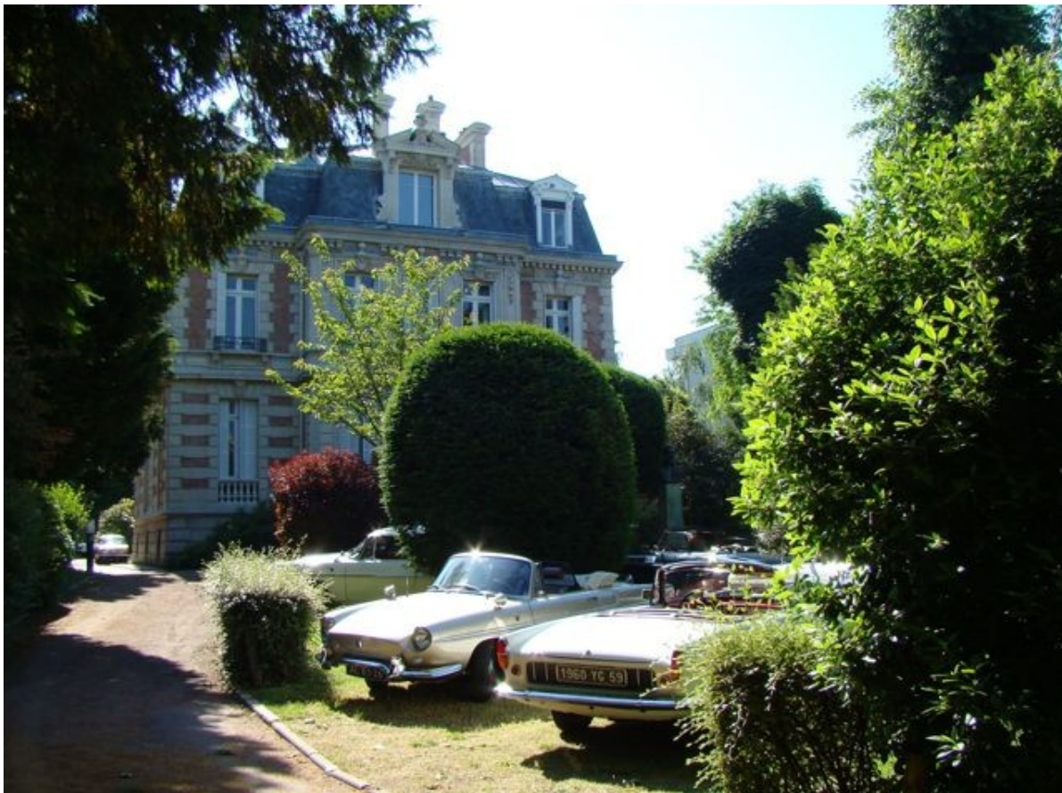
Visite du Musée historique Renault dans un joli pavillon de banlieue appartenant à une association amicale d'anciens ouvriers Renault.