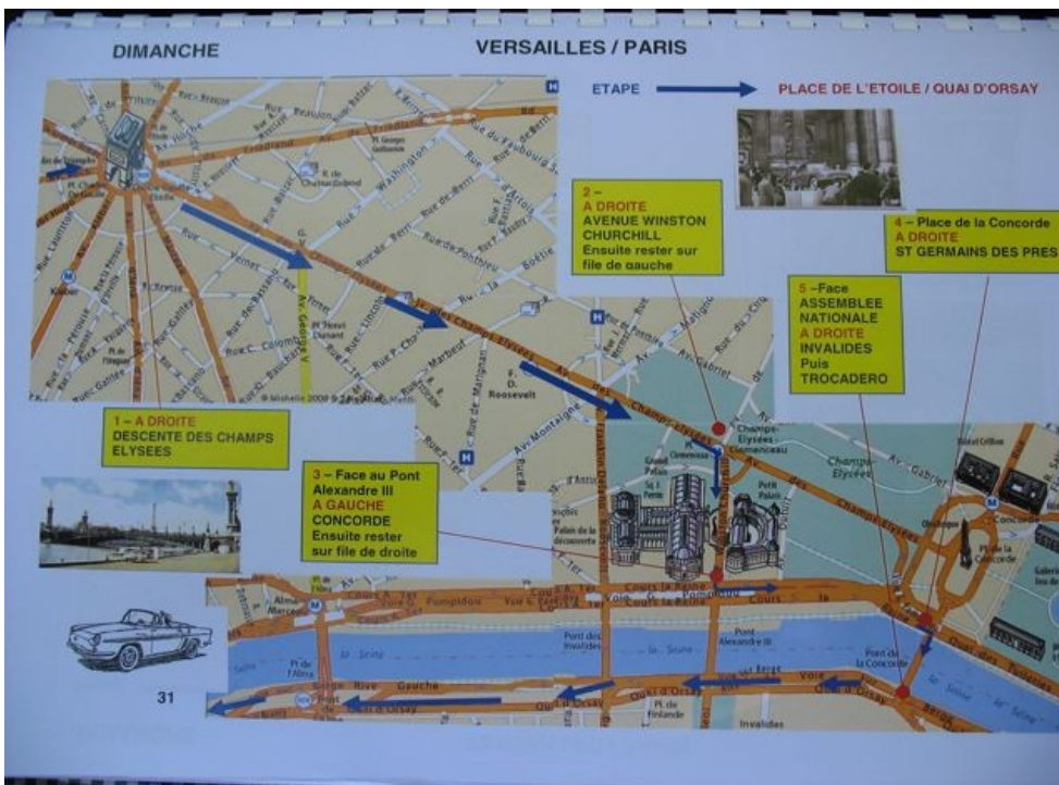
Road book du Dimanche 31 Mai.