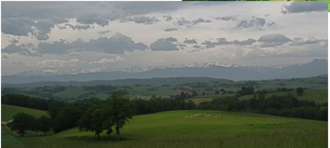
Les neiges éternelles en toile de fond