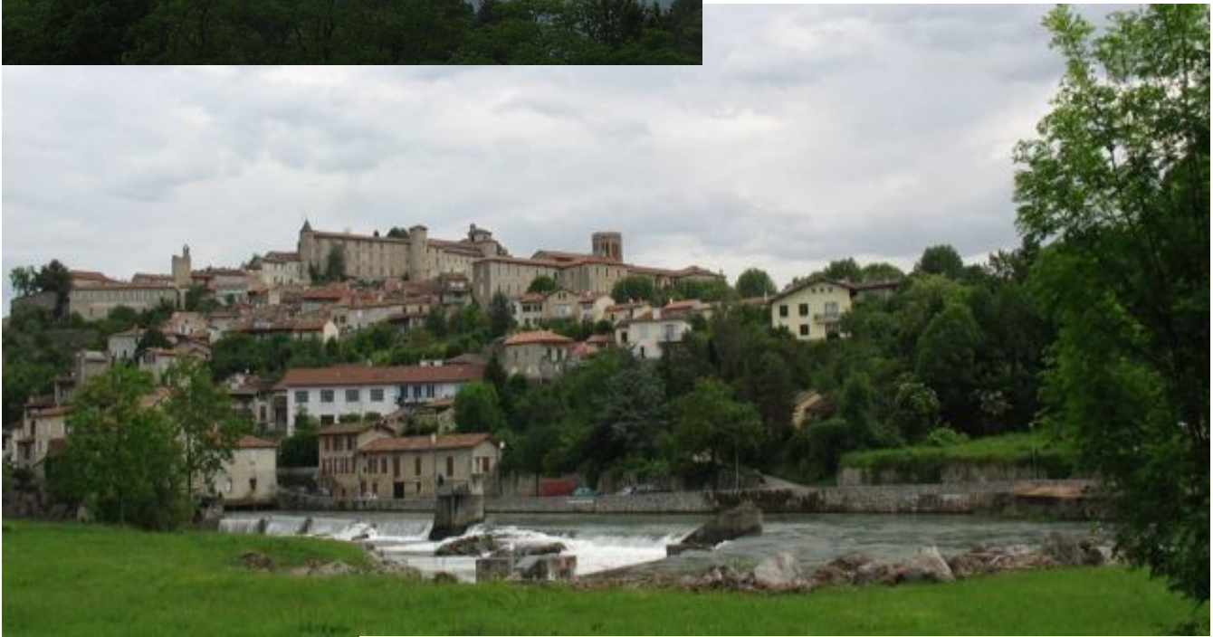
A Martory, les eaux tumultueuses de la Garonne.