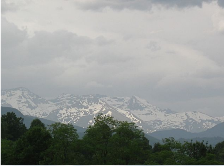
St Lizier V V